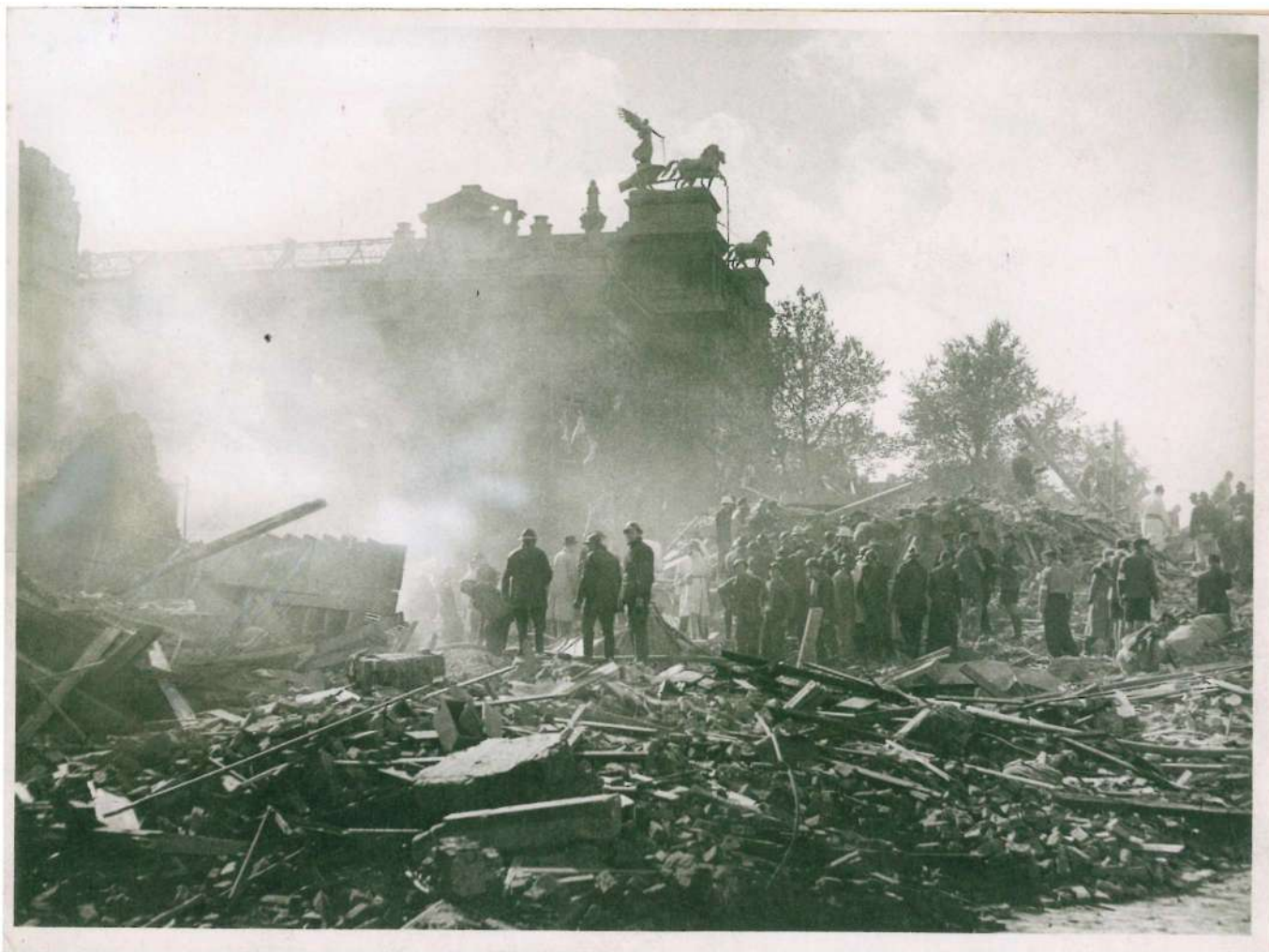
De puinhoop aan de noordzijde van het museumgebouw na de inslag van een V2-bom op 13 oktober 1944.

'Dat de vleugels van de paarden bewegen lijkt soms alarmerend voor bezoekers en buurtbewoners, maar is normaal.'