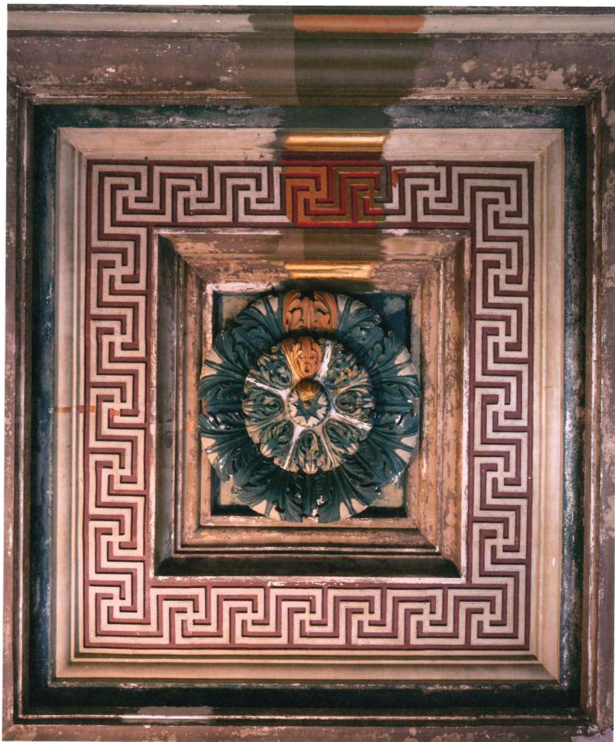
Het cassettenplafond van de zuilengalerij krijgt zijn oorspronkelijke kleuren terug.