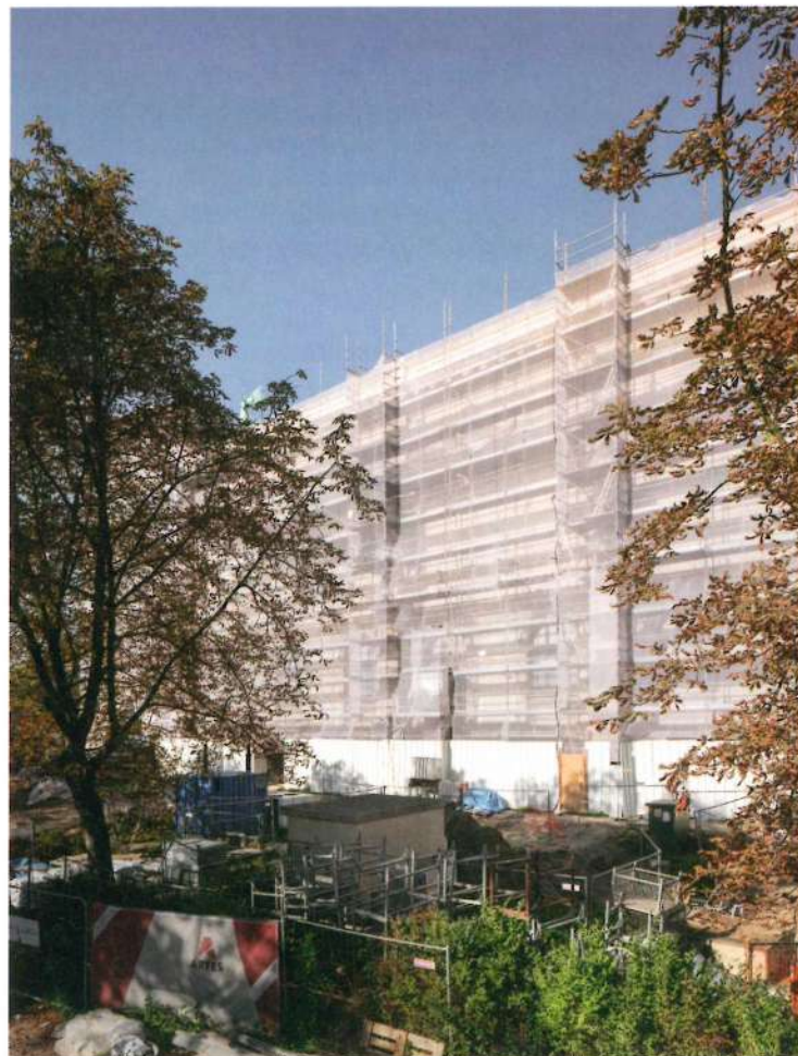
De museumgevel aan de Beeldhouwerstraat in de steigers